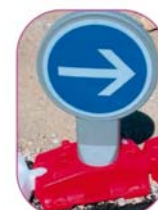
Saam Lest + B21-1