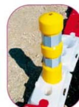
Saam Lest + K5d