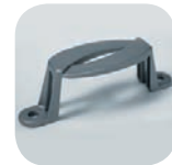
Bride city 80 x 40 mm