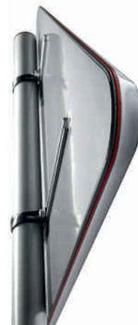
Caisson Lx3® City Aluminium laquable

Lx3® a été récompensé pour son design par un Janus de l'industrie 2008 et une étoile décernée par l'Observateur du design 2009