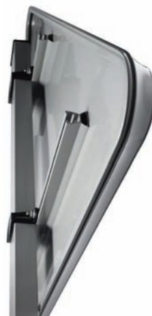
Panneau Lx3® First Aluminium laquable