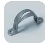
Bride city Ø 60 mm