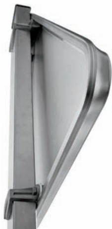
Panneau Lx3® Concept AluZinc